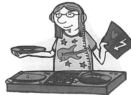
Der Discjockey mag Softrock (Soft Rock).

Zusammen oder getrennt – aus dem Englischen stammende Bildungen aus Adjektiv und Substantiv können zusammengeschrieben werden, wenn nur der erste Bestandteil betont wird: das/der Hotdog/Hot Dog , der Softdrink/Soft Drink , der Softrock/Soft Rock aber: Electronic Banking, High Society, New Economy